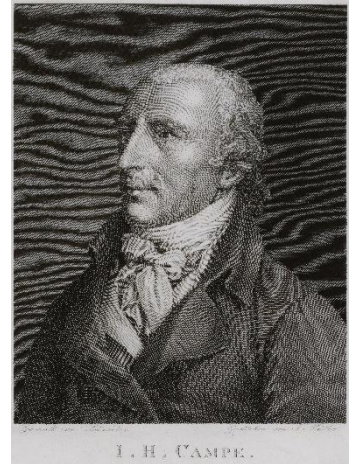
Joachim Heinrich Campe. – Kupferstich von F. Müller.

Joachim Heinrich Campe aus Deensen besuchte unsere Schule von 1760-1765. Er ist der Namensgeber unserer Schule seit ihrer Umbenennung 1990. Das weiß man. Viel weiß man vor allem über seine publizistischen Erfolge als begeistertem Anhänger der Ideen der Aufklärung. Aber wie war das in seiner Kindheit und Jugend, als er noch in Deensen und Holzminden lebte? Er selbst hat dazu einiges im Lauf seiner schriftstellerischen Tätigkeiten veröffentlicht.