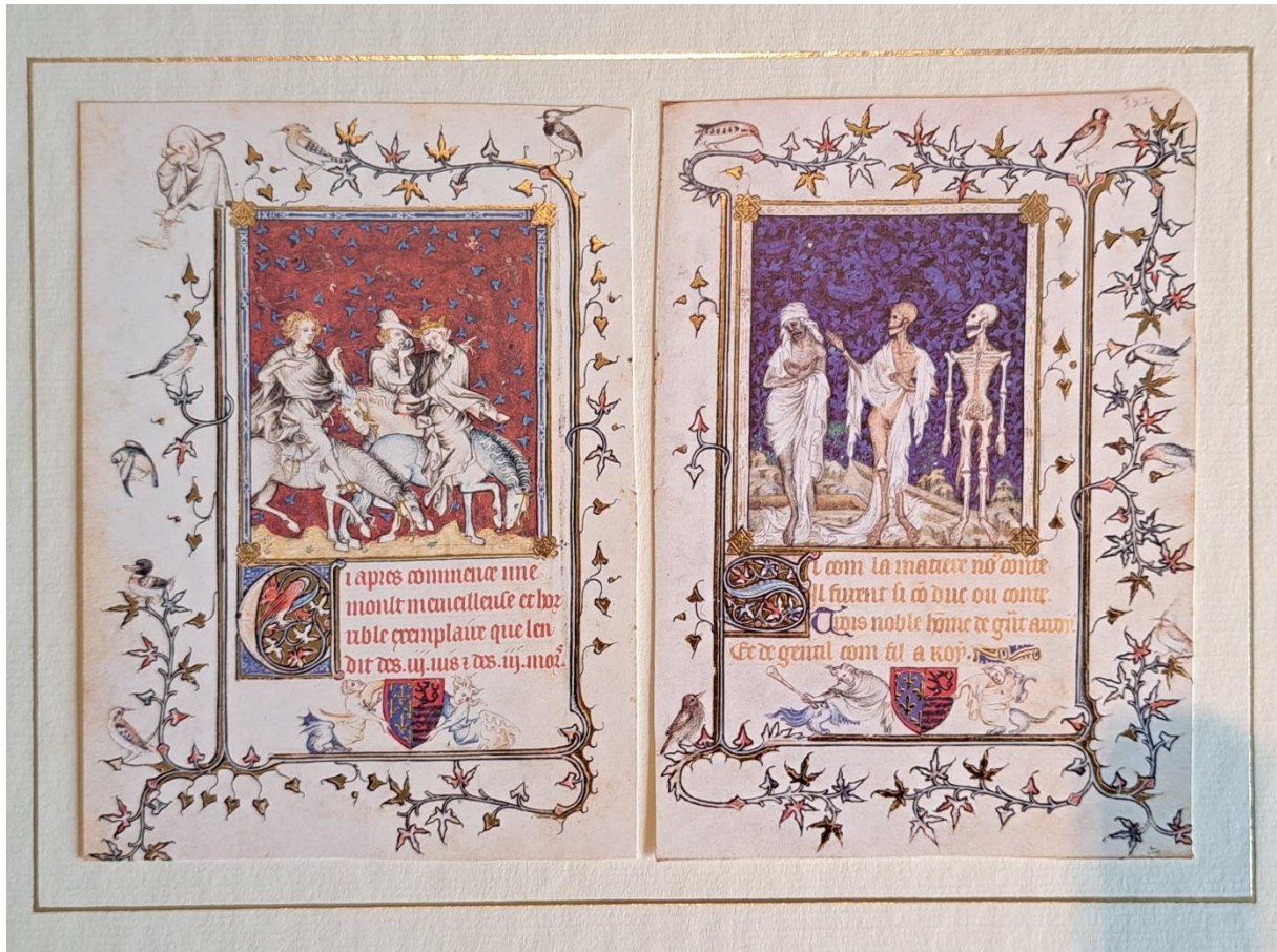
„Die drei Lebenden und die drei Toten“ Aus dem Stundenbuch der Bonne de Luxembourg. Paris, vor 1349. Faksimile mit 23 ½ Karat Gold. Heute im Metropolitan Museum, New York

“Atlas sive cosmographicae meditationes de fabrica mundi et fabricati figura”, ein kiloschwerer, originalgroßer Nachdruck des allerersten Weltatlas von Mercator aus dem Jahr 1595 mit zahllosen kolorierten Kupferstichen der damals bekannten Welt findet sich darunter, wie auch viele bezaubernde Buchmalereien aus acht Jahrhunderten, teils mit Blattgold und allesamt Auszüge aus mittelalterlichen Stundenbüchern, Bibeln oder dem Evangeliar Heinrichs des Löwen in limitierter Auflage aus dem Coron- Verlag. Gerade Buchmalereien zählen neben den erhaltenen Bauwerken und Schriften zu den bedeutendsten Zeugen mittelalterlicher und frühneuzeitlicher Kunst, Kultur und Gesellschaft.